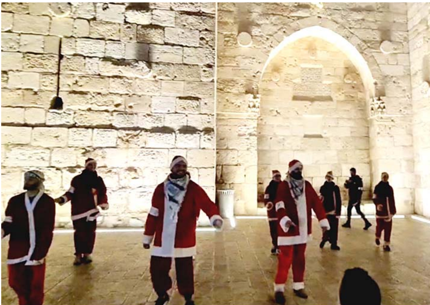
...tanzende Weihnachtsmänner vor dem Jaffa-Tor an der Jerusalemer Altstadtmauer